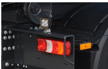
Mehr Verkehrssicherheit und bessere Sicht mit den MEILLER Beleuchtungen in LED-Technik.