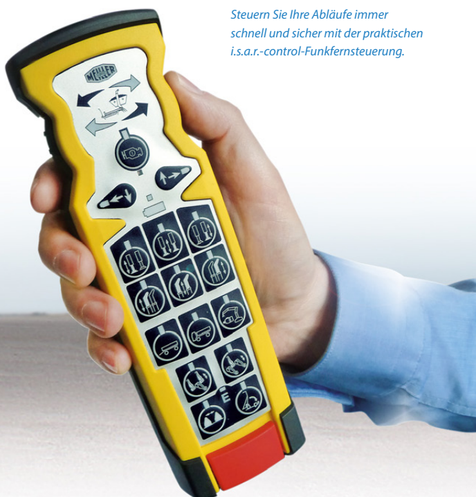
Steuern Sie Ihre Abläufe immer schnell und sicher mit der praktischen i.s.a.r.-control-Funkfernsteuerung.