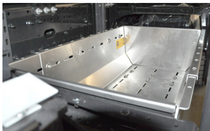
Raum optimal genutzt: Netzkästen zwischen den Achsen.