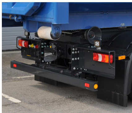
Unterfahrerschutz immer an der richtigen Stelle: beim Kippen und Abrollen eingeschoben, beim Fahren ausgezogen.