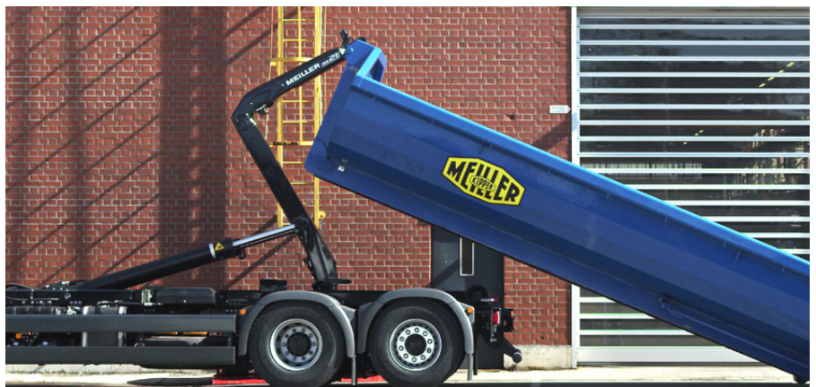
Das MEILLER Hydrauliksystem ist speziell auf die Anforderungen in der Bau- und Entsorgungswirtschaft konzipiert.