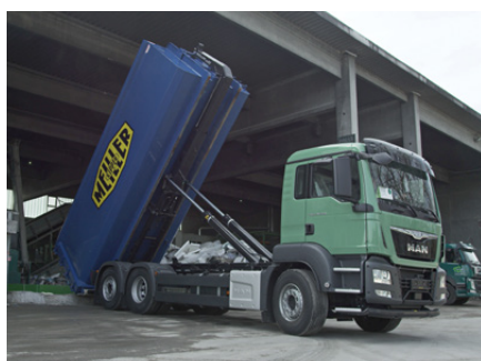
Mehr Spielraum bei Überdachungen durch den niedrigeren Aufbau des Abrollkippers RS 21.

Gewinnen Sie mehr Fahr- und Standsicherheit durch den tiefliegenden Schwerpunkt des Abrollkippers RS 21. Die um 20 mm verringerte Bauhöhe sorgt für mehr Schwenk- und Kippraum in Tiefgaragen oder überdachten Plätzen.