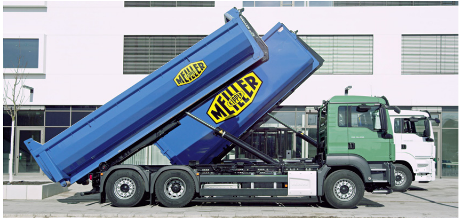
Kaum einzuholen: Der neue Abrollkipper RS 21 senkt sich mit Effizienzpaket doppelt so schnell als sein Vorgänger.

Das Effizienzpaket beinhaltet Eilgang-, Schnellgang-, Folgesteuerung- und Endlagendämpfungs-Systeme.